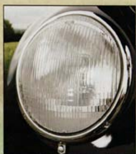
Ultra-complet, ce Hebmüller possède toutes ses caractéristiques d'époque, y compris les verres de phares avant siglés VW.

Sur les petites routes des environs de Bad Camberg, le Hebmüller s'avère idéal pour découvrir la région.