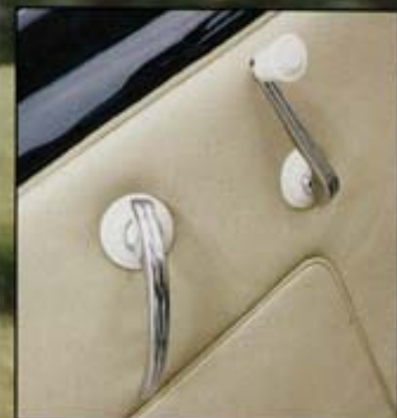
Les poignées de portes sont les mêmes que pour une Coccinelle Split. Ce sont des modèles nervurés.