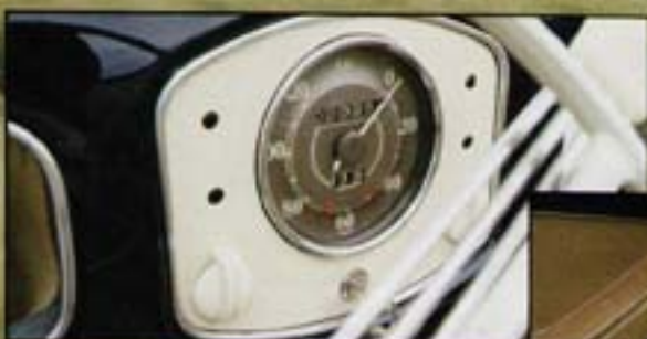
Rare! Ce compteur de vitesse de Split VDO est doté d'un totaliseur journalier. Une référence ultime pour un modèle ultime!