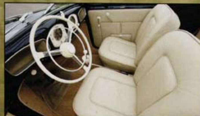
La sellerie en cuir beige est de toute beauté. On s'éloigne des caractéristiques d'une voiture populaire pour grimper en gamme!