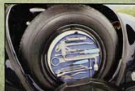
Sur la roue de secours, la boîte à outils Hazel optionnelle d'époque est complète.