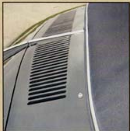
Les grilles de refroidissement sont toujours situées à l'aplomb de la soufflante du moteur, au-dessus du capot arrière.

En 2005, le cabriolet est enfin achevé juste avant le fameux meeting de Hessisch Oldendorf. Présentée au public, l'auto rencontre un vif succès. D'ailleurs, les lecteurs de Super VW Magazine se souviennent très certainement de sa présentation dans nos pages. Un modèle noir aux flancs de couleur crème. Une petite merveille restaurée à la perfection ! A noter qu'entre-temps, en 2004, Claus a pris soin d'acquérir une autre