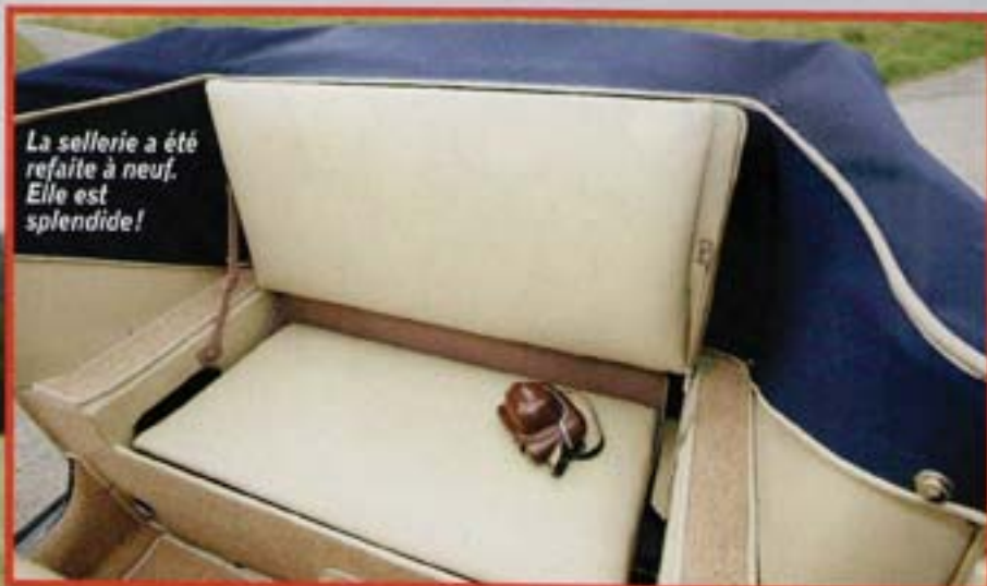
La sellerie a été refaite à neuf. Elle est splendide!