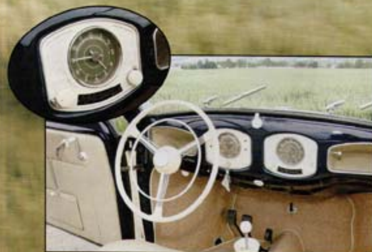
Le tableau de bord est bien proportionné grâce à la présence d'une horloge intégrée au niveau de l'autoradio Becker, modèle Monza.