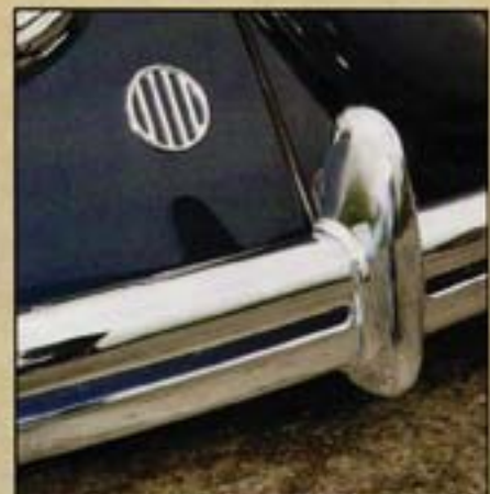
Les pare-chocs nervurés sont relevés par une touche de couleur identique à celle de la carrosserie.

Toujours au fil de ses rencontres et de ses découvertes, Claus se voit proposer une autre Coccinelle incroyable. Une Split de 1951, qui affiche 67 000 km d'origine, dans un état excep-