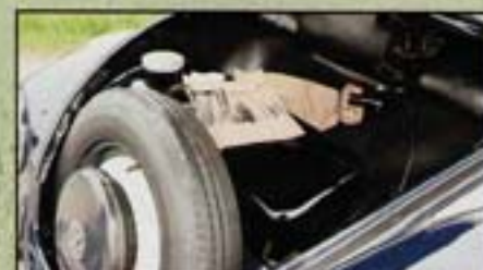
Dans le coffre avant, la trousse à outils et le cric sont rangés dans des housses en tissu de sellerie de Split d'époque.