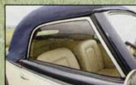
Pas de déflecteurs pour les vitres latérales de ce modèle, mais un cadre de vitre en aluminium.