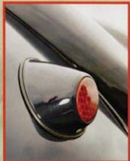
Les petits feux arrière sont bien ceux de l'année millésime 1950.