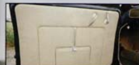
Les panneaux de portes sont eux aussi en cuir, avec au centre un vide-poches discrètement intégré.