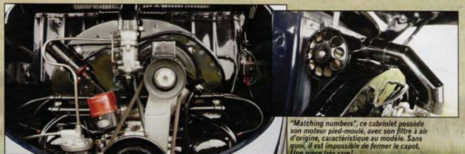
"Matching numbers", ce cabriolet possède son moteur pied-moulé, avec son filtre à air d'origine, caractéristique au modèle. Sans quoi, il est impossible de fermer le capot. Une pièce très rare !