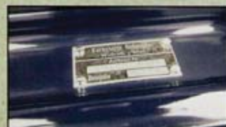
Derrière la roue de secours, dans la jupe avant, la plaque du constructeur, celle de la Karosserie Hebmüller.